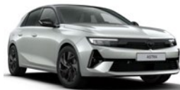
Gris Kristall métallisé