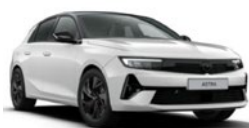
Blanc Arktis opaque