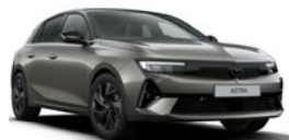
Gris Vulkan métallisé