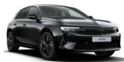
Noir Karbon métallisé